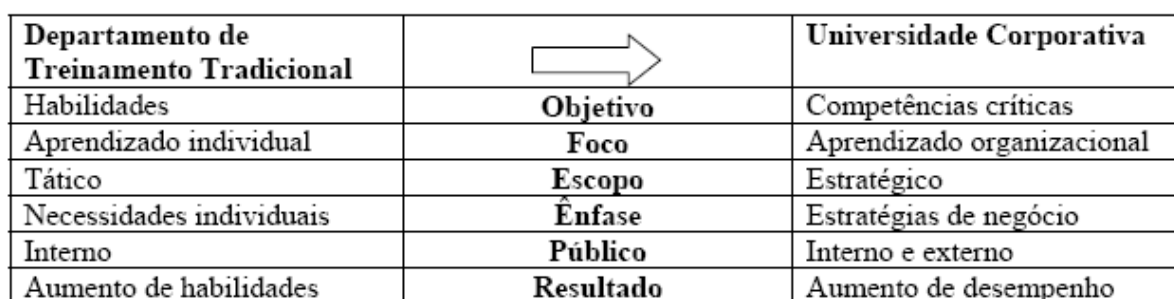
Quadro 1 – Treinamento e Desenvolvimento tradicional x Universidades Corporativas

Eboli (1999) vê as Universidades Corporativas como um avanço das organizações em relação aos centros de treinamento tradicionais, que ilustrativamente podem assim ser comparados: