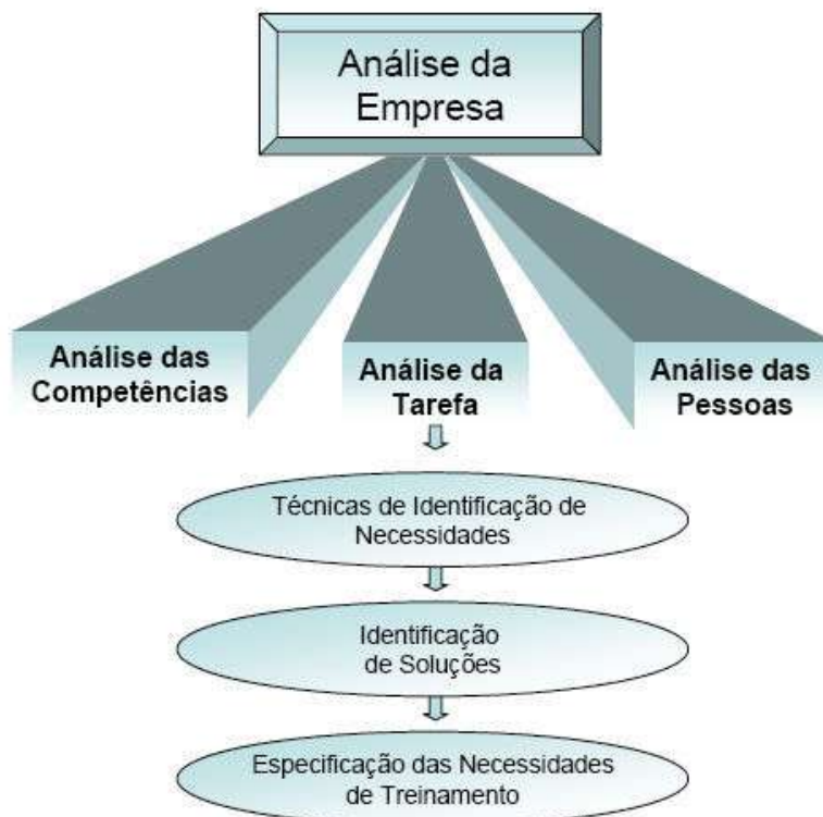
Figura 3: Representação Gráfica da seqüência de atividades necessárias ao Levantamento de Necessidades de Treinamento

A Figura 3 representa a seqüência de atividades necessárias para a realização do Levantamento de Necessidades de Treinamento: