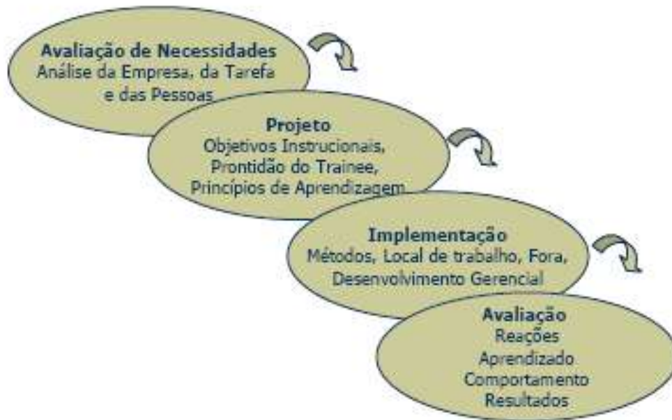
Figura 2: Modelo de Sistemas de Treinamento

Para Bohlander, Snell e Sherman (2003), visão próxima do que menciona Abbad (1999), para se ter certeza de que os investimentos realizados em treinamento sejam capazes de causar o máximo de impacto, deve-se recorrer à abordagem sistêmica do treinamento, para sua implantação na organização, conforme descrito na figura 2: